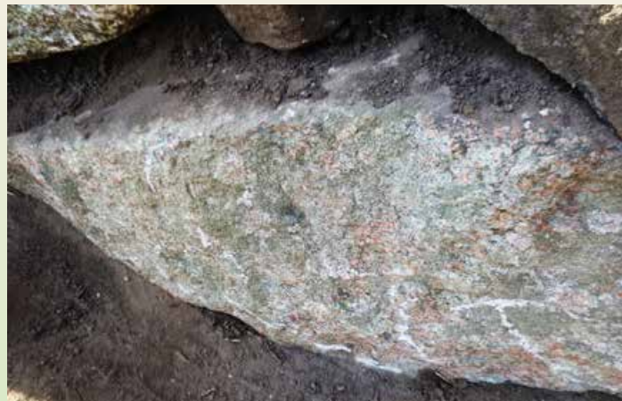
Skålsten fra bronzealderen ved Havnbjerg Kirke.