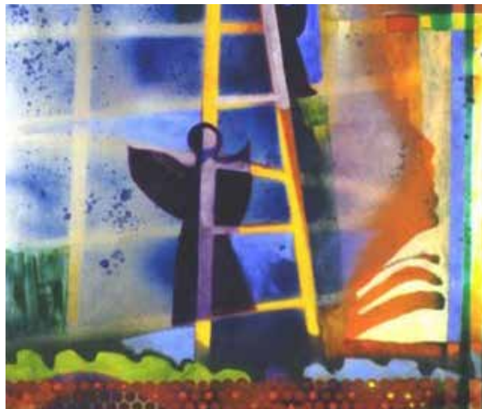
Jacob så en stige. (1. Mosebog 28)