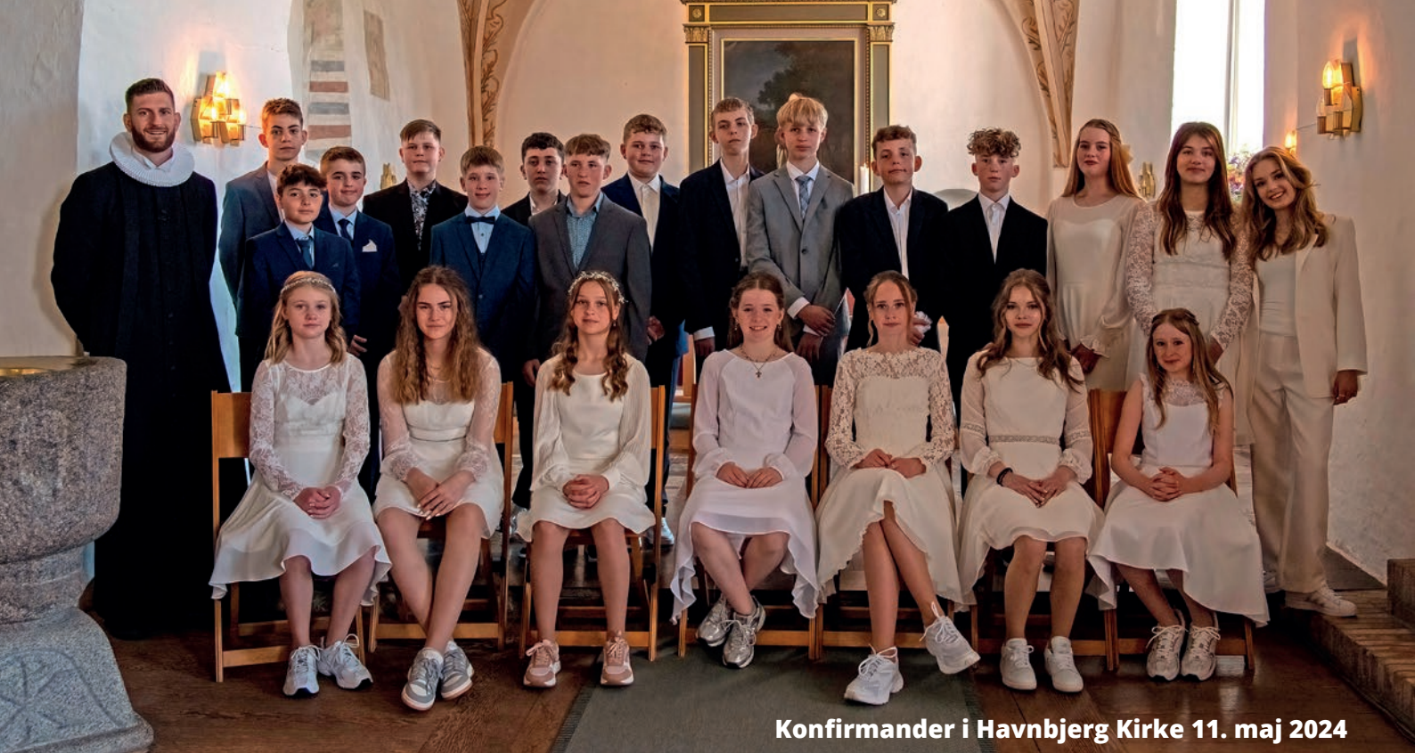
Konfirmander i Havnbjerg Kirke 11. maj 2024